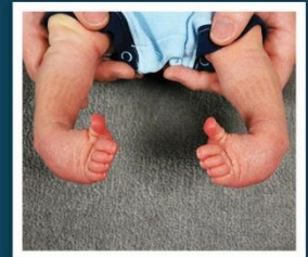
Afecciones de los pies