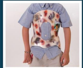
Afecciones de la columna vertebral