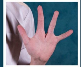
Afecciones de las manos